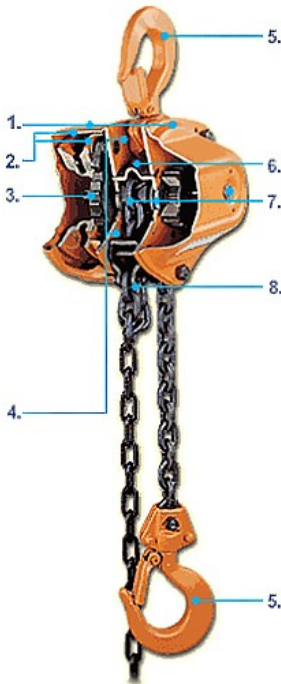
Рис. 3: 1 - Стальной штампованный корпус; 2 - Двойное защитное покрытие; 3 Тормозной механизм; 4 - Двойные надежные защелки у трещотки; 5 Нижний и верхний крюк; 6 - Направляющие грузовой цепи; 7 - Игольчатый полшпипник; 8 - Закрепление конца цепи.

• Могут быть укомплектованы передвижной тележкой-кошкой (Таль Ручная Шестеренная Передвижная).